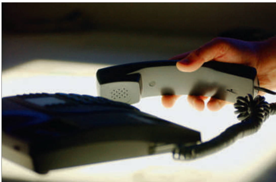
■ Le téléphone sonne, mais celui qui appelle n'est pas toujours celui qui a composé le numéro de son correspondant. Danger !